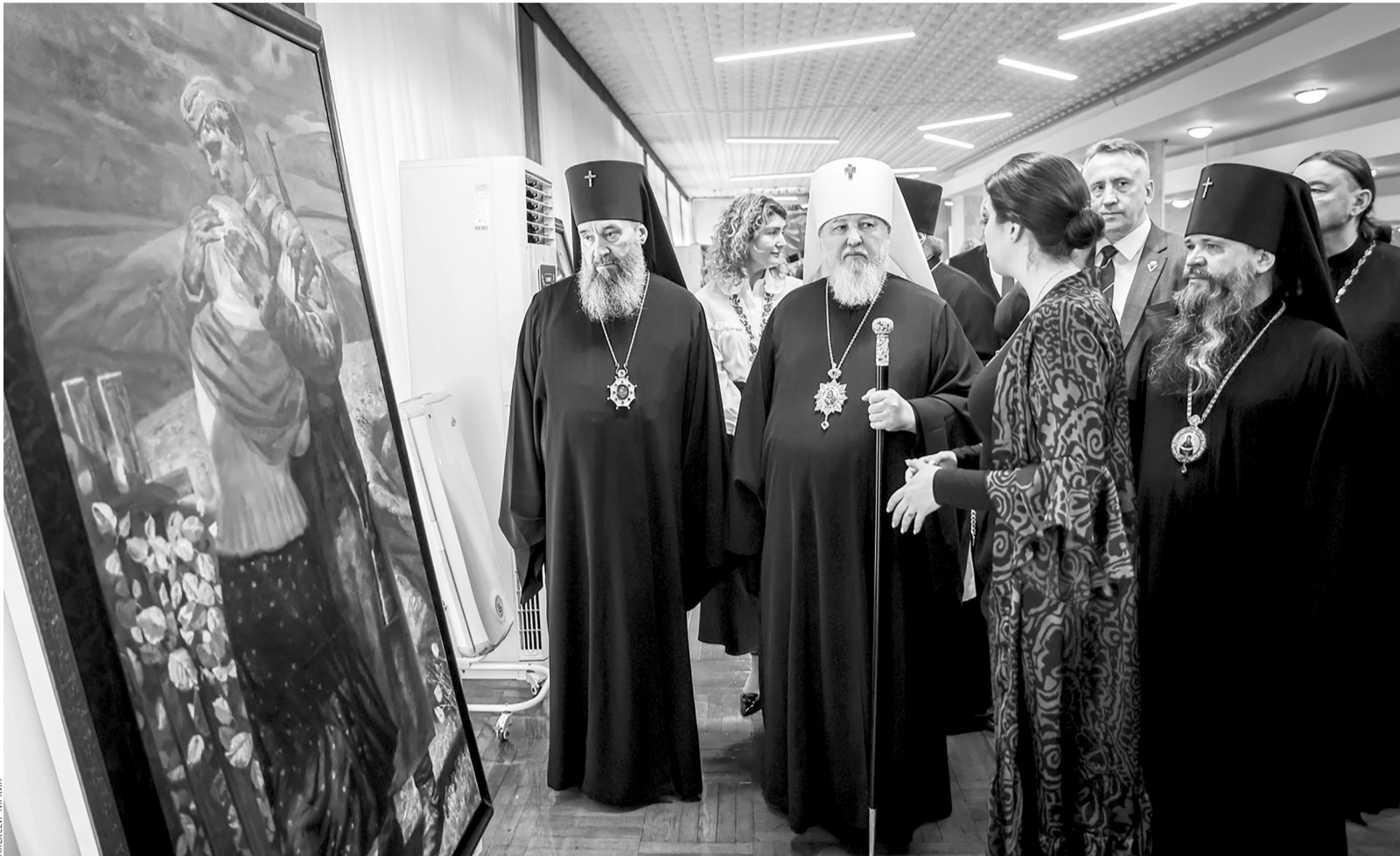
Митрополит Кирилл осматривает выставку работ современных художников, посвященную специальной военной операции

— В окопах никаких межконфессиональных проблем нет, — подчеркнул архиерей, — когда