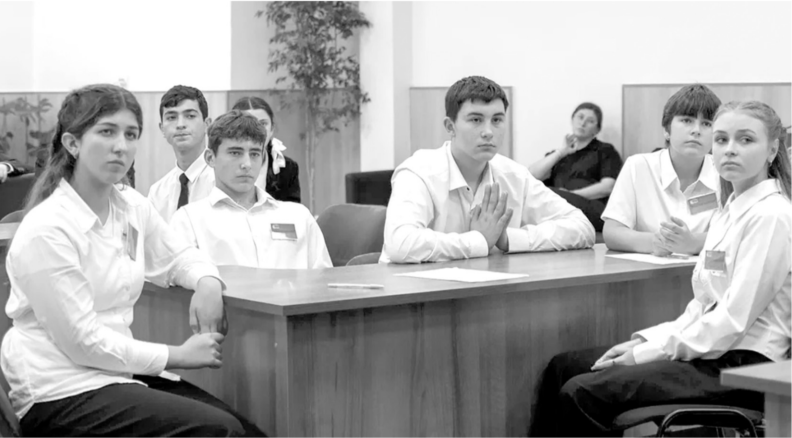
Участники квиза в Черкесске внимательно слушают ведущего